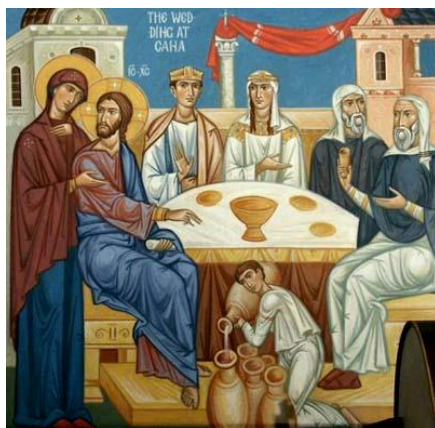
(Свадба у Кани Галилејској)

Када је ријеч о Новом Завјету, много је примјера гдје Христос на посредан или непосредан начин говори о људском достојанству и међуљудским односима. Ја ћу сада усмјерити пажњу на јеванђелску причу у којој је Христос благословио брак на свадби у Кани Галилејској. (Прочитати Јеванђеље по Јовану 2. 1.-11.)