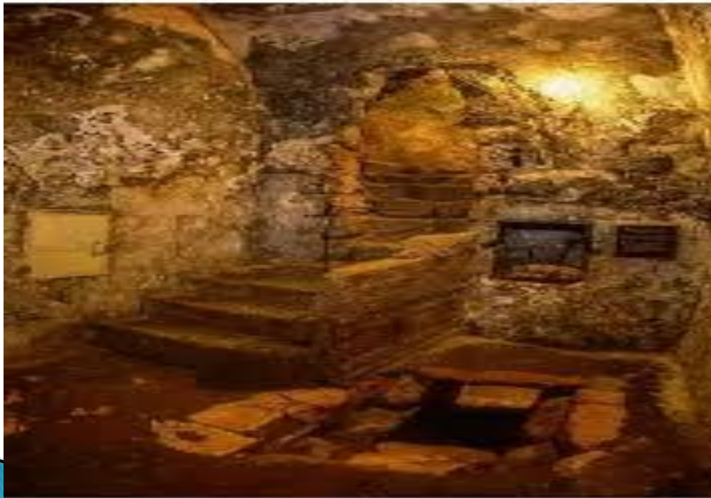
Гроб Праведног Лазара у Витанији